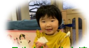
1月生まれのお友達